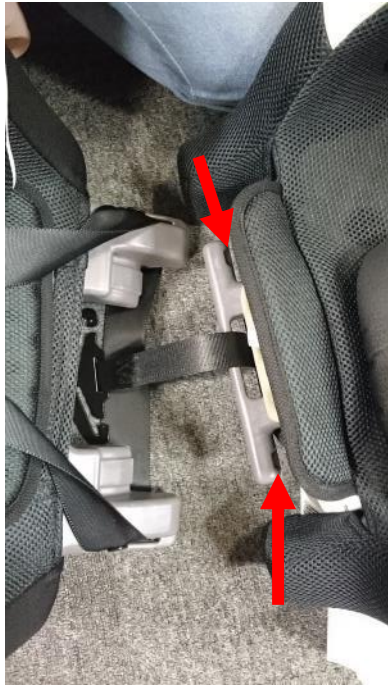
13. 將椅背與座墊結合