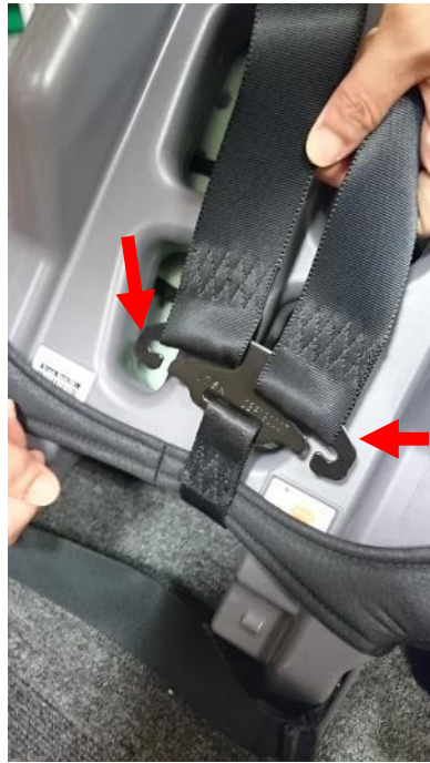
14. 再將安全帶穿過固定鐵片。