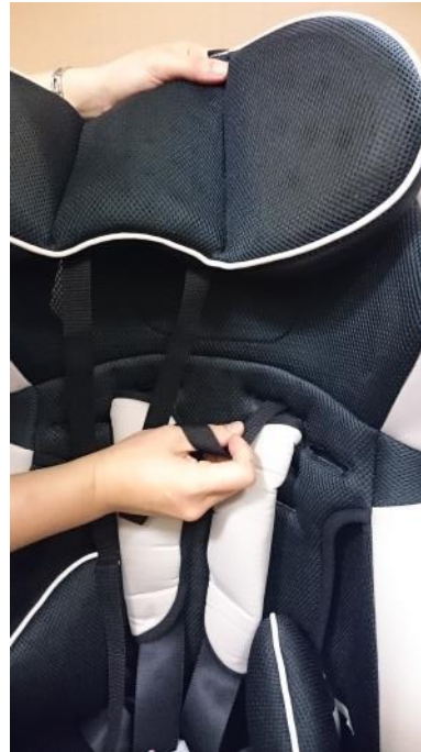
15. 最後將頭部靠墊裝上後完成。